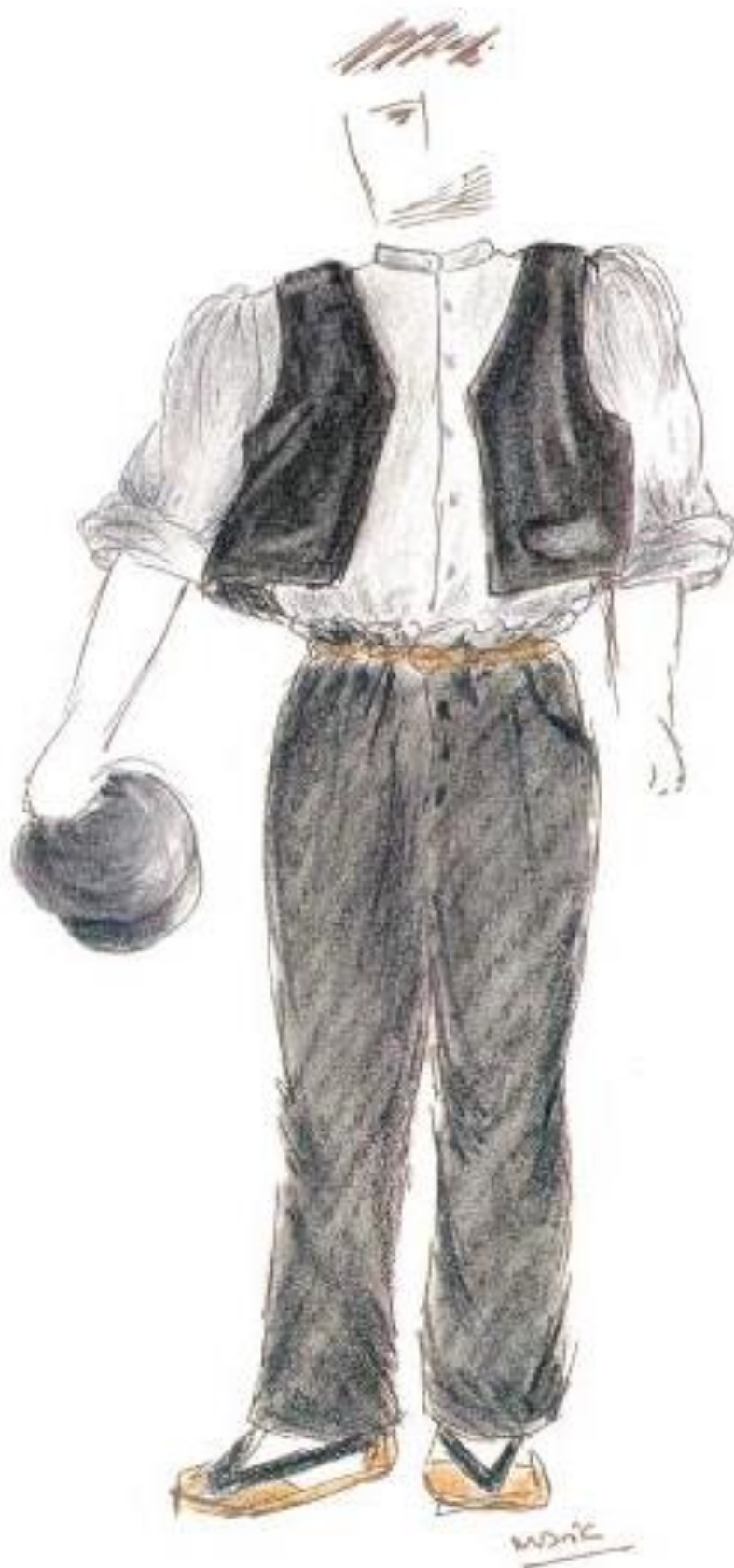
Home del camp