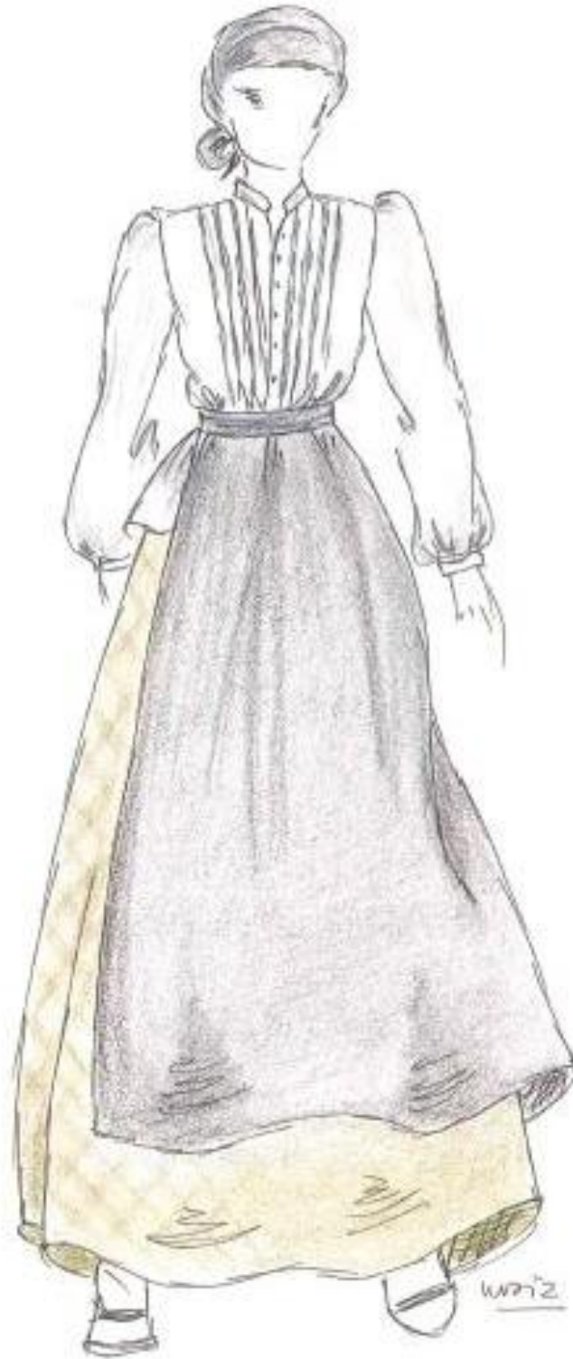
Dona del camp