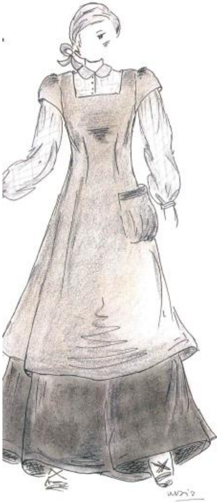
Dona treballadora a la fàbrica