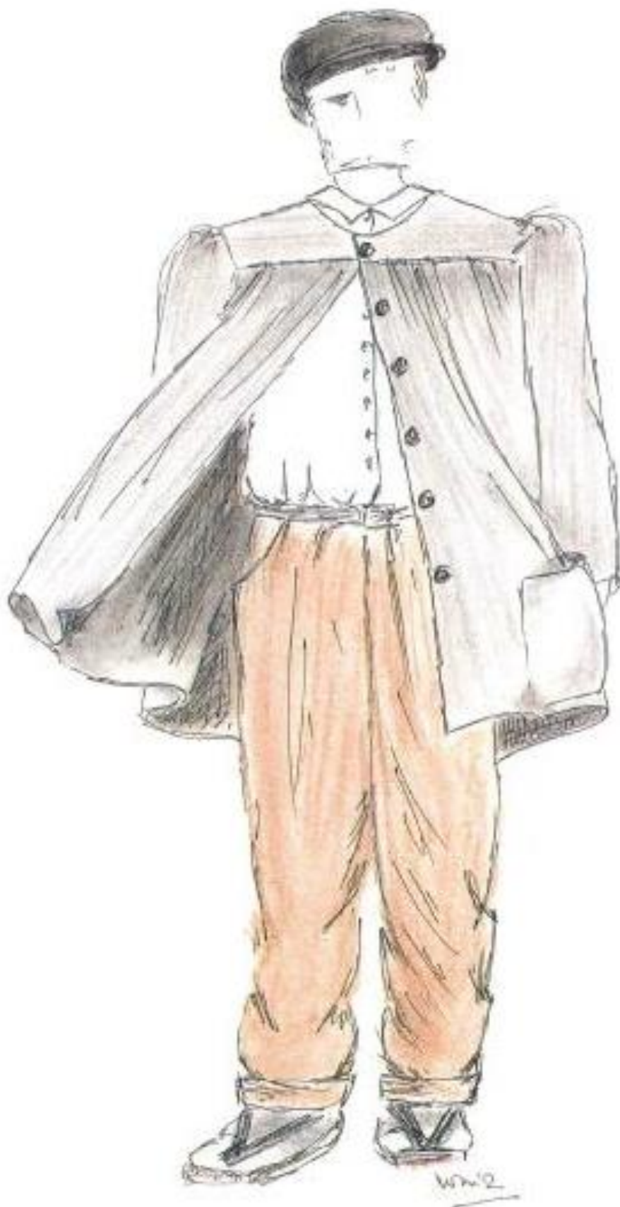
Home treballador a la fàbrica