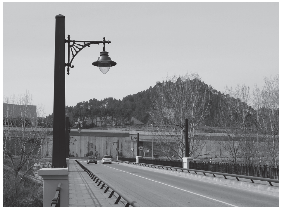
FANALS ACTUALS DEL PONT; JORDI LARGO: Es pot apreciar que són una rèplica dels originals.