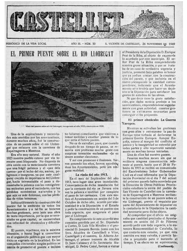
Portada del Periòdic Castellet de 29 de novembre de 1949, on es va publicar la primera part d'un reportatge dedicat a la construcció del primer pont de Sant Vicenç

A partir d'aquesta exposició primerenca del senyor Canal, s'ha escrit força sobre la construcció del pont i, se'n va