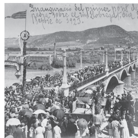
Família Andrés Canal

El pont que comunica la carretera C-55 amb el poble de Sant Vicenç i salva el riu Llobregat és un pont de pedra i ciment que fa aproximadament 200 m de llarg, amb dos carrils per vehicles i dos per vianants separats del central amb una barana baixa de ferro. El pont se suporta sobre pilars que recolzen quatre arcs de 25 metres de llum cadascun. A la part de sota del pont es pot observar perfectament l'ampliació realitzada l'any 1997. En aquesta es va procurar mantenir l'estètica de la primera obra, inclòs el sistema d'il·luminació del pont, que recorda als primers fanals que es van instal·lar. També es va recuperar la mateixa barana del primer pont. El primer pont es va fer de pedra extreta de la pedrera del Clot del Tufau i els arcs es van fer amb cimbres sobre les quals es posaven les dovelles. L'obra actual és de ciment armat.