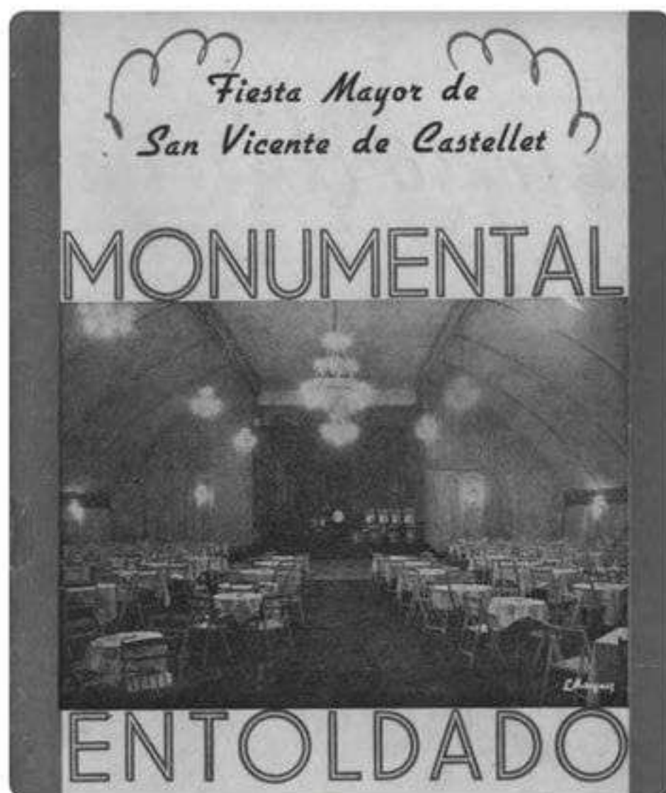
Programa de Festa Major de Sant Vicenç de 1961

Enguany, amb motiu del desè aniversari d'una de les festes més importants del municipi, com és actualment la Fira de Vapor, i motivats per la importància