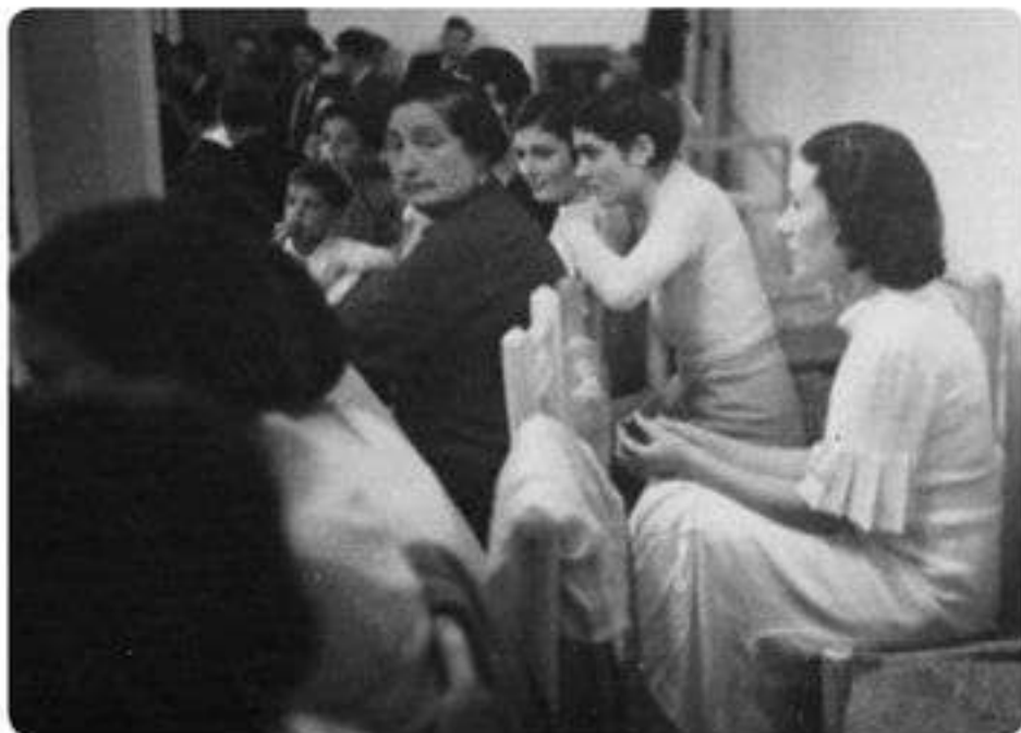
Interior de l'Ateneu, als anys trenta.