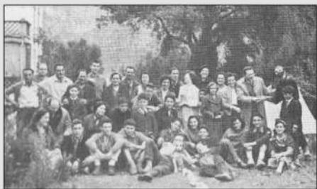
8 de juny de 1958. Centre Excursionista de Sant Vicenç a l'Aplec de Sant Pere de Vallhonesta

També es practicaven altres esports com els escacs i l'atletisme, amb esdeveniments destacats com les curses de cros Manresa-Sant Vicenç, de gran prestigi en l'àmbit estatal.