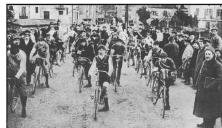
1911. Volta Ciclista a Catalunya.

En definitiva, la Catalunya de principis del segle XX no es pot entendre sense la pràctica esportiva. L'esport modern català entra a les escoles, als barris i a la vida quotidiana, construint societat i cultura col·lectiva. I degut a la massificació i la democratització de l'esport a partir dels anys vint, neix també la premsa esportiva.