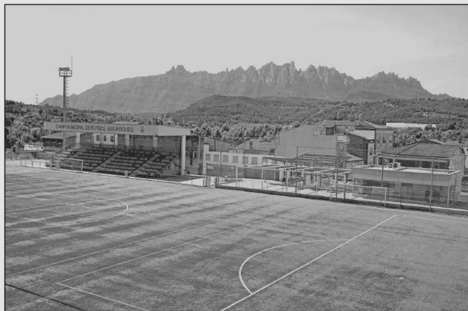
Camp Municipal de Futbol Les Roques 2026.