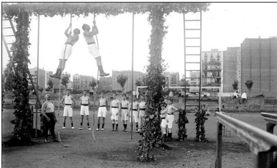
1915. Festival Atlètic del Gimnàs Vila al camp del Català Sport Club. Barcelona

Catalunya viu l'arribada de l'esport modern durant el darrer terç del segle XIX de la mà de la industrialització del país. De fet, l'expansió de l'esport està molt lligada a les relacions comercials i industrials que van afavorir l'arribada de comunitats estrangeres, especialment britàniques, però també alemanyes, franceses i austríaques, que coneixien els esports moderns i els transmetien als ciutadans locals.