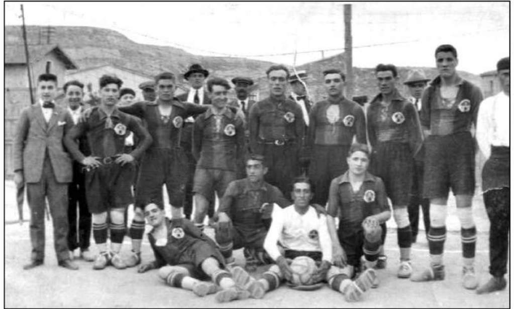
Equip del Club Futbol Sant Vicenç l'any 1926

En una època en què el futbol s'havia convertit en un dels esports més populars de Sant Vicenç, els equips creixien notablement. Per això, l'any 1925 va ser necessari iniciar la construcció d'un nou camp, que es va acabar inaugurant el 2 d'octubre de 1926.