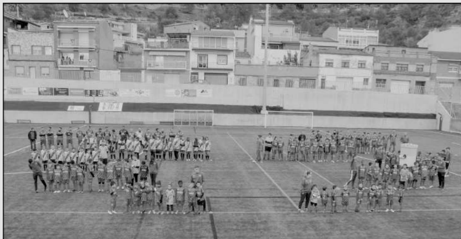
Presentació dels equips en la inauguració de la remodelació del camp de futbol el novembre de 2019.

1916. Folletó que anunciava un partit de futbol del CF Sant Vicenç durant la festa major.