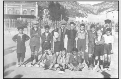
1916. Equip infantil que va derivar en la creació del Club Futbol Sant Vicenç. El terreny de joc estava davant l'estació de la Renfe i al carrer Mura